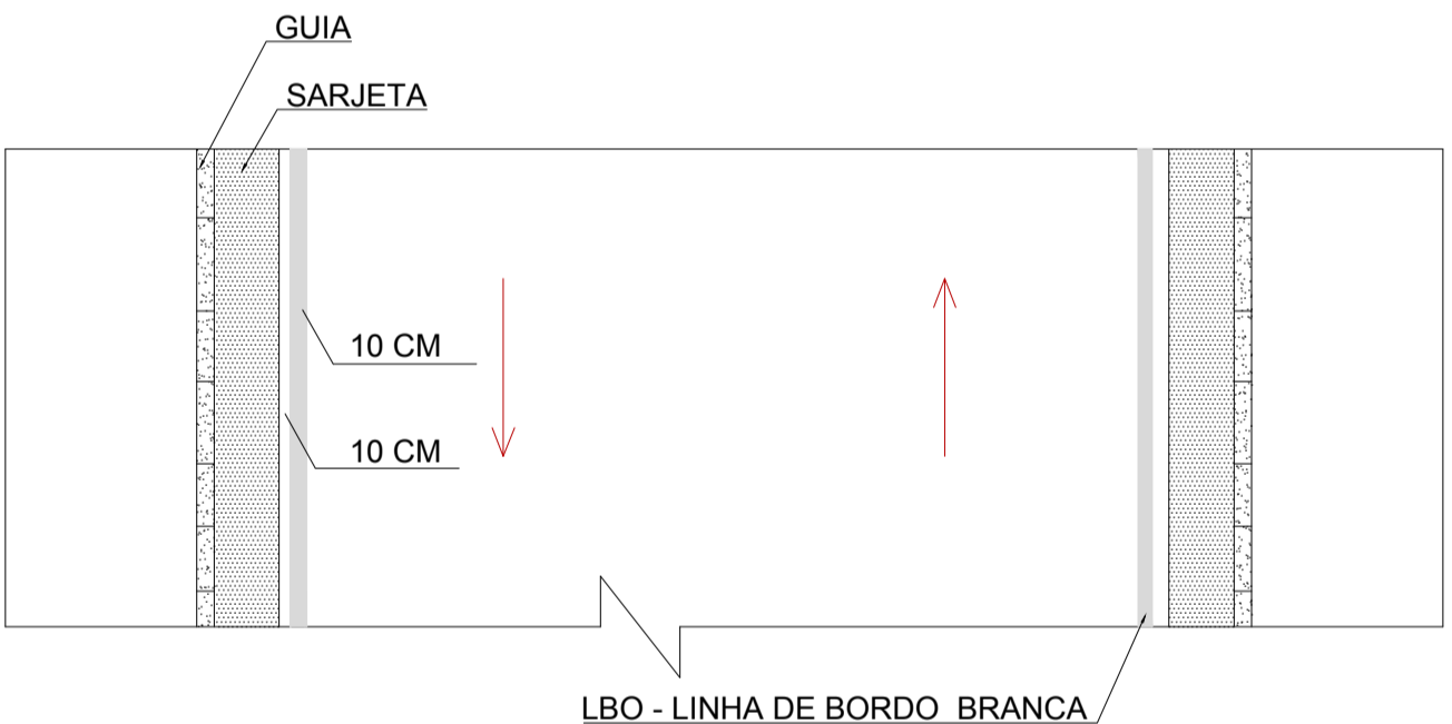
DETALHE DA PINTURA SEM ESCALA