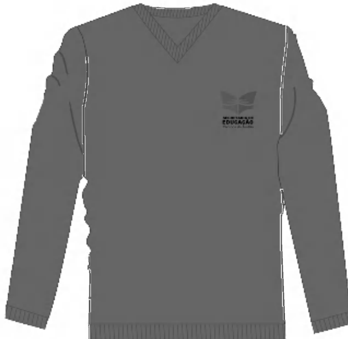
TABELA DE MEDIDAS DE PRODUTO ACABADO

Suéter tecido em máquina eletrônica, com dois cabos de fio com composição 50% algodão 50% acrílico com tolerância de +/- 8%, na cor Cinza, pantone de referência 18-0503 TCX, com gramatura de 350 g/m 2 com tolerância de 8% para mais ou para menos. Barra e punhos tecidos juntos com o corpo e manga, respectivamente, em esquema de seleção 2x2, também na cor Cinza, mesma cor do corpo, confeccionadas utilizando fio de mesma composição do original para evitar a migração de cores. Gola em "V" tecida separada do corpo e/ou manga, em esquema de seleção 2x1, cor Cinza, mesma cor do corpo. Corte do tecido nas dimensões desejadas realizada de maneira manual, por profissional apto e especializado na operação, união das peças tecidas e cortadas como mangas, frente e costas realizadas na máquina Overlock para obter melhor qualidade de acabamento e durabilidade. Gola aplicada no corpo utilizando-se de máquina Remalhadeira, que confere melhor qualidade e durabilidade de acabamento. Etiqueta fixada na parte interna da peça acabada de caráter permanente informando a razão social, CNPJ, marca, composição do tecido, símbolos/instruções de lavagem, tamanho e país de fabricação. Na parte da frente do suéter no lado esquerdo de quem veste, deverá ser aplicado o do logo da Secretaria de Educação nas cores originais bordado em linhas, com a quantidade mínima de 6.990 pontos, nas seguintes medidas de: 8,0 cm de largura por 8,0 cm de altura.