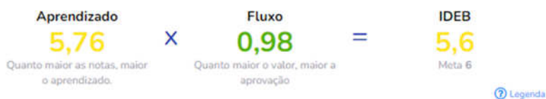
Evolução do IDEB