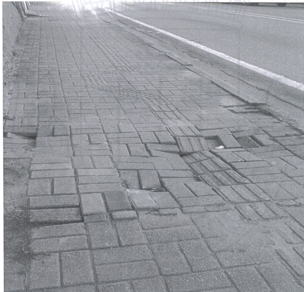
Em frente ao nº1244