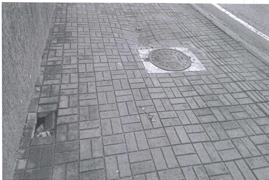
Em frente à Construforte- materiais de construção

O MELHOR DO MUNDO (CONGRESSO CLIMATOLÓGICO DE PARIS)