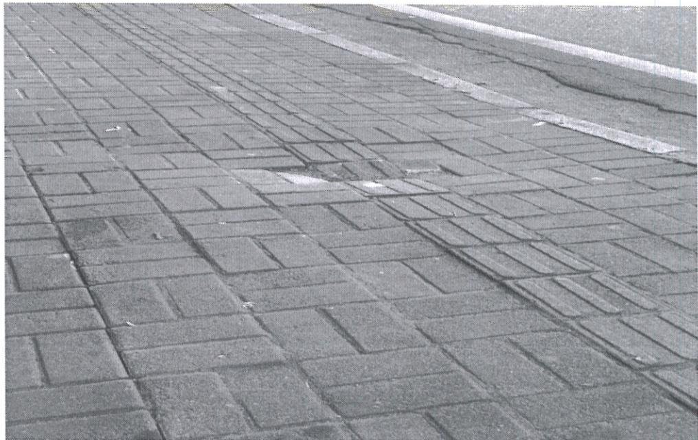
Em frente ao nº 1205

O MELHOR DO MUNDO (CONGRESSO CLIMATOLÓGICO DE PARIS)