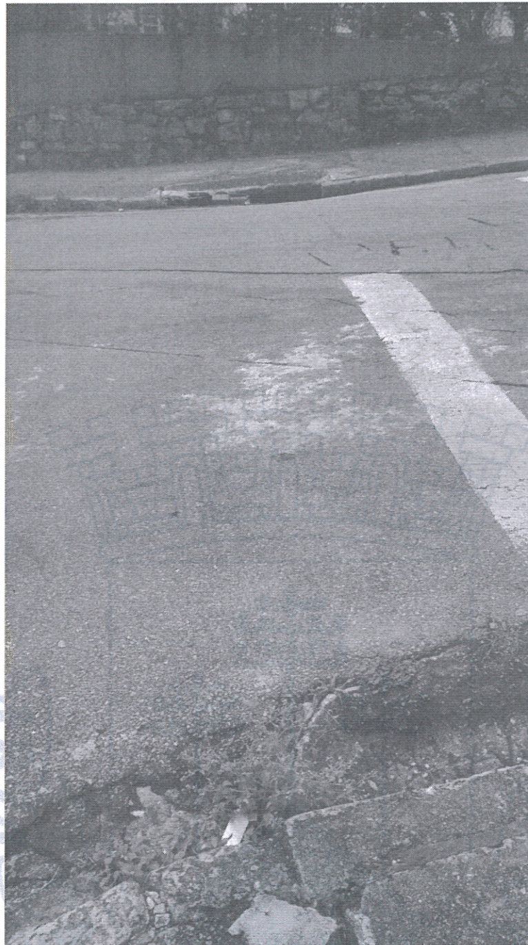
FOTO PARA REFERENCIA DA LOCALIZAÇÃO DA TAMPA

O MELHOR DO MUNDO (CONGRESSO CLIMATOLÓGICO DE PARIS)