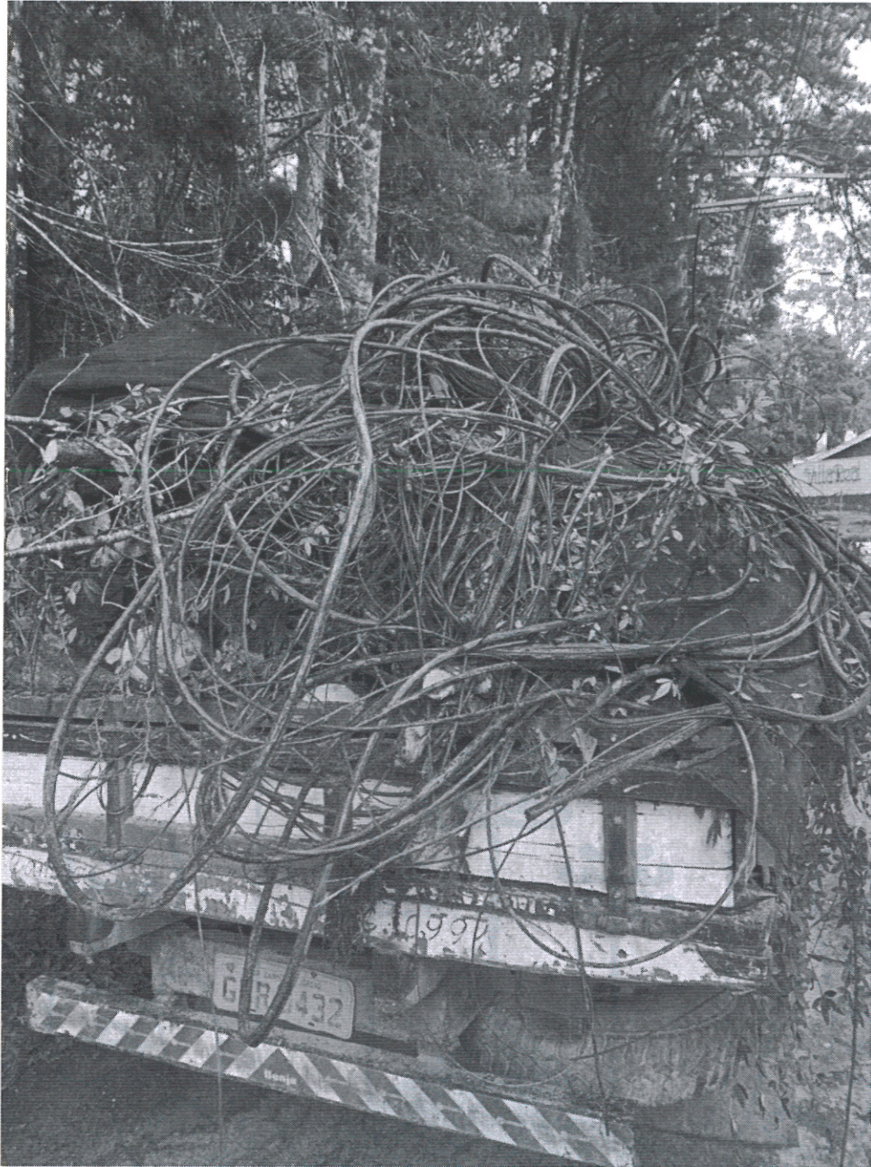
Imagem da última limpeza realizada pelos moradores.